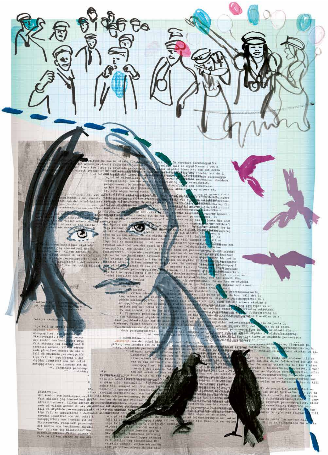
Illustration: Jenny Svenberg Bunnell.